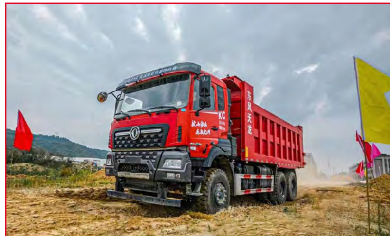
DONGFENG KC (Euro 5)