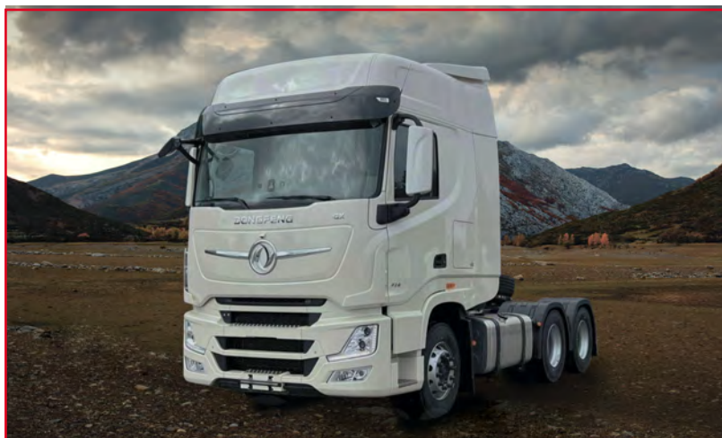
DONGFENG GX (Euro 5)