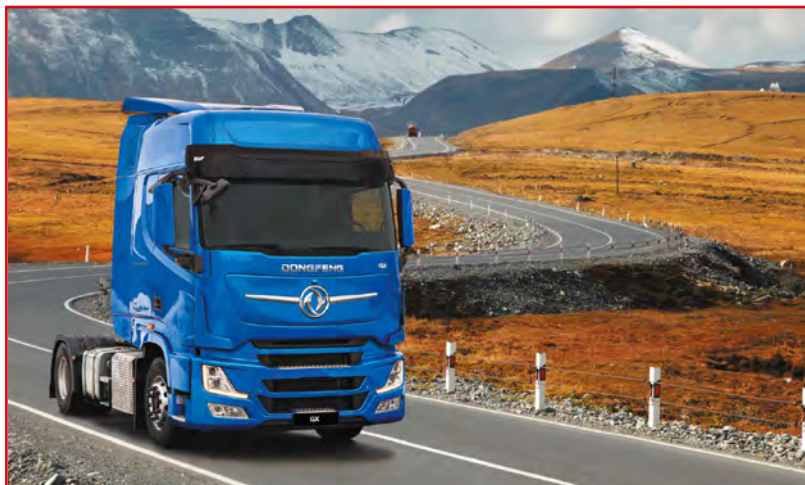
DONGFENG GX (Euro 5)