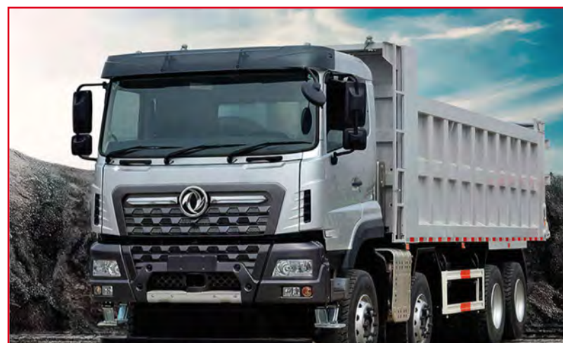
DONGFENG KC (Euro 5)